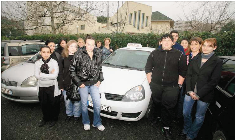
Pour la première fois en Corse, une auto-école sociale vient d'ouvrir ses portes au centre social de Paese-Novu. Ce dispositif national permettra chaque année à vingt-cinq jeunes de passer leur permis de conduite.

Après un travail de diagnostic élaboré pendant un an, l'association a obtenu l'agrément